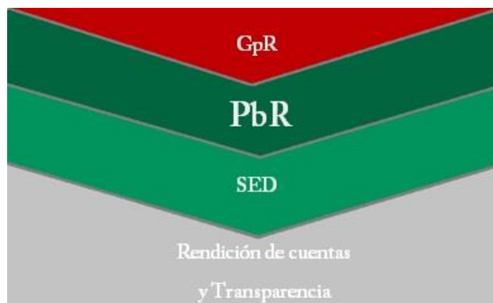
Esquema obtenido de la SHCP

El Sistema de Evaluación del Desempeño (SED) se liga con el Presupuesto basado en Resultados (PbR) en el Marco del nuevo Modelo de Gestión en base a Resultados (GbR), mismo que se está implementando en Nayarit a partir de las diversas reformas constitucionales y legales aplicadas desde el 2008 a nivel nacional.